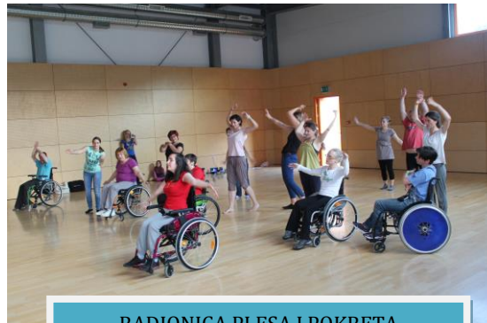
RADIONICA PLESA I POKRETA