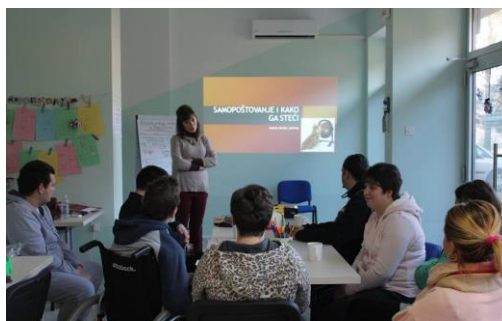
„PRAKTIČNA KUĆA ZNANJA“ - DUGA RESA

9.) Projekt „Praktična kuća znanja“ - jačanje socijalnog uključivanja osoba s invaliditetom u zajednicu u okviru Poziva na dostavu projektnih prijedloga "Širenje mreže socijalnih usluga u zajednici – faza 3. Partneri na projektu su: Karlovačka županija, Grad Duga Resa i Hrvatski zavod za zapošljavanje, Područni ured Karlovac. Suradnici i korisnici su: Društvo multiple skleroze Karlovačke županije i Udruga invalida rada Duge