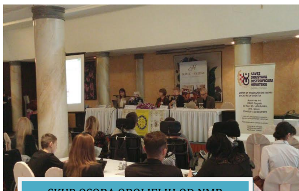
SKUP OSOBA OBOLJELIH OD NMB