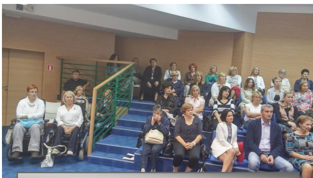
PREDSTAVLJANJE KNJIGE „OČUH I KOPILE“