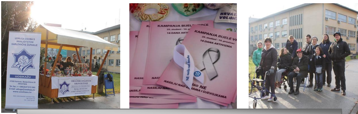
KAMPANJA BIJELE VRPCE – 16 DANA AKTIVIZMA

Zajednica saveza osoba s invaliditetom – SOIH već nekoliko godina provodi kampanju „Bijele vrpce“ kao „16 dana aktivizma“ počevši od 25. studenog – Međunarodnog dana borbe protiv nasilja nad ženama“, 03. prosinca – Međunarodnog dana osoba s invaliditetom, zatim 05. prosinca – Međunarodnog dana volontera te 10. prosinca – Međunarodnog dana ljudskih prava. Udruga se uključila na način da su korisnici Praktične kuće znanja obilježili zadnji dan kampanje Bijele vrpce - NE nasilju nad ženama i povodom navedenog predstavili kreativne radove korisnika i edukativne materijale na štandu u Dugoj Resi.