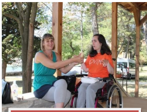
USLUGA OSOBNEN ASISTENCIJE

2.) Treća i posljednja godina trogodišnjeg programa „Usluge osobne asistencije osobama s najtežim invaliditetom“ za period 2013./2015., financiranog od Ministarstva socijalne politike i mladih. Pružanje usluga osobne asistencije za 11 korisnika s najtežim vrstama invaliditeta koje su u svim aktivnostima svakodnevnog življenja ovise o pomoći druge osobe. Usluga osobne asistencije obuhvaćala je obavljanje transfera krevet kolica i obrnuto, odlaske na toalet, odijevanje, pripremu hrane i hranjenje, te obavljanje drugih poslova prema uputi korisnika. Zadovoljstvo korisnika osobnom asistencijom iskazano je u velikoj mjeri. Značajnu ulogu u kvaliteti provedbe usluge osobne asistencije ima partner, a to je Zajednica saveza osoba s invaliditetom Hrvatske – SOIH, čiji stručnjaci provode edukacije i konzultacije.