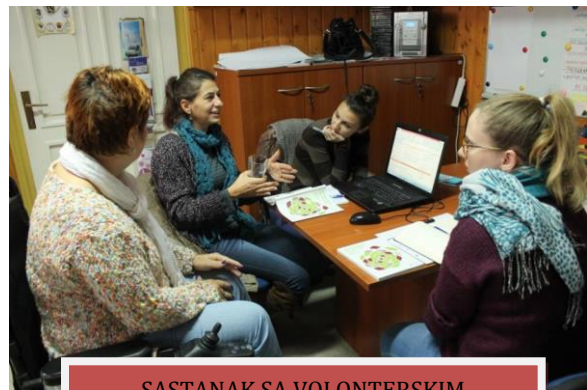
SASTANAK SA VOLONTERSKIM CENTROM ZAGREB

11.) Projekt financiran iz Europskog socijalnog fonda „Solidarnost i kvaliteta u pružanju socijalnih usluga“ čiji je nositelj Udruga "MI" iz Splita. Partneri na projektu uz Udrugu osoba s invaliditetom Karlovačke županije su: Volonterski centar Osijek, Volonterski centar Zagreb, Udruga za razvoj civilnog društva - Smart, i Udruga za prevenciju socijalno patološkog ponašanja mladih, Nova gradiška. Projekt direktno unaprjeđuje organizirano uključivanja volontera (menadžment volontera) kroz edukaciju predstavnika OCD-a.