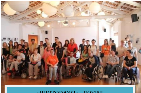
«PHOTODAYSIS» - ROVINJ