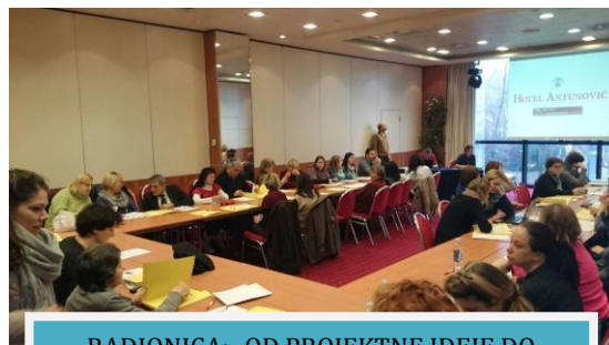
RADIONICA: „OD PROJEKTNE IDEJE DO USPJEŠNE PRIJAVE NA ESF NATJEČAJ“

• Radionica u Zagrebu „Od projektne ideje do uspješne prijave na ESF natječaj“ u okviru natječaja „Širenje usluge osobne asistencije za osobe s invaliditetom“ u organizaciji Ministarstva socijalne politike i mladih.