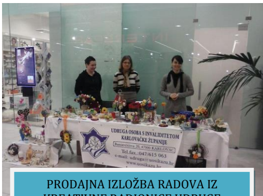
PRODAJNA IZLOŽBA RADOVA IZ KREATIVNE RADIONICE UDRUGE