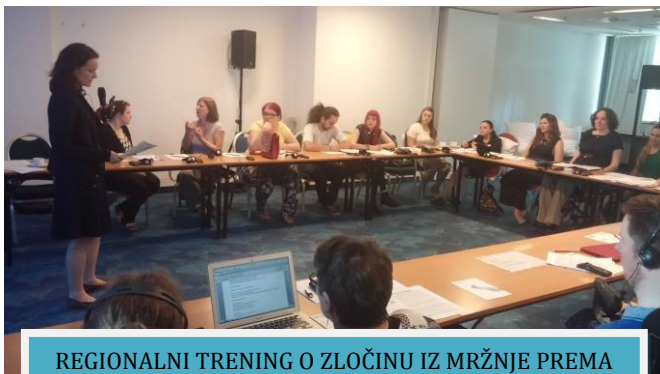
REGIONALNI TRENING O ZLOČINU IZ MRŽNJE PREMA OSOBAMA S INVALIDITETOM

• Predstavljanje otvorenih natječajâ u organizaciji Zaklade za poticanje partnerstva i razvoja civilnog društva u suradnji sa Gradom Karlovcem. Predstavljanje je održano u Karlovcu uz veliki interes organizacija civilnog društva.