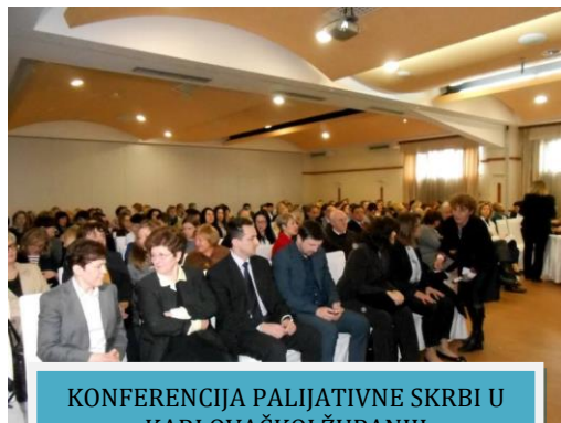
KONFERENCIJA PALIJATIVNE SKRBI U KARLOVAČKOJ ŽUPANIJI