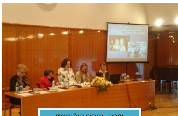
STRUČNI SKUP - POSI