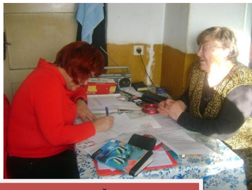
USLUGA POMOĆI U KUĆI NA PPDS (TOUNJ, JOSIPDOL I PLAŠKI)