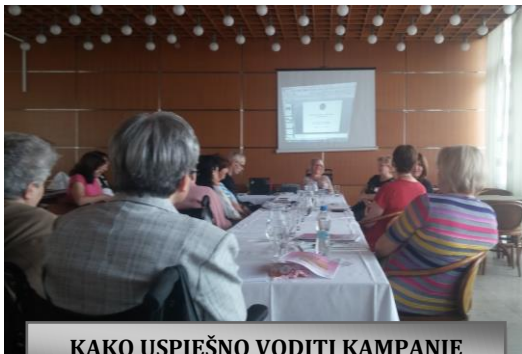
KAKO USPJEŠNO VODITI KAMPANJE

djelovanja u zagovaranju ženskih ljudskih prava. Kroz 5 paralelnih radionica izrađeni su planovi kampanja obilježavanja: 8. ožujka, 15. svibnja, 22. rujna, 25. studenoga do 10. prosinca i 10. prosinca. Predlošci će služiti za pripremu i provođenje kampanja u lokalnim udrugama u cijeloj Hrvatskoj.