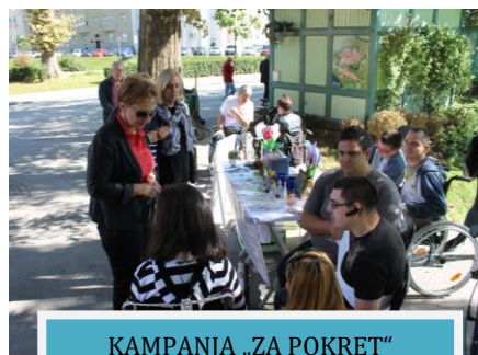
KAMPANJA „ZA POKRET“