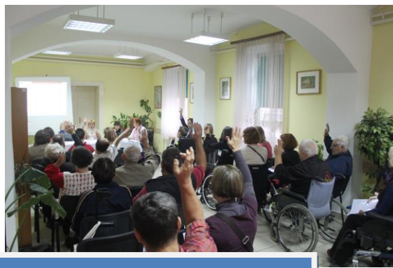
IZBORNA SKUPŠTINA UDRUGE - 25. RUJNA 2015.

Udruga može osnivati i druga tijela potrebna za ostvarivanje ciljeva Udruge u skladu sa Statutom, Čl. 49. U odluci o osnivanju tijela utvrđuje se sastav tijela, ciljevi osnivanja, prava i obaveze tijela i članova tijela te vrijeme na koje se tijelo osniva.