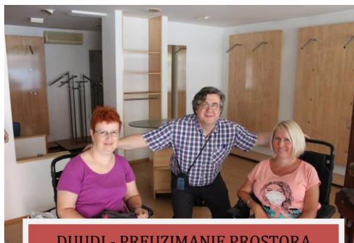
DUUDI - PREUZIMANJE PROSTORA

6.) Projekt odobren od Državnog ureda za upravljanje državnom imovinom za dodjelu državnih prostora. Udruzi je odobren prostor na adresi Petra Zrinskog 11, Karlovac. Za korištenje istog potpisan je Ugovor na 5 godina. Prostor je opremljen za rad.