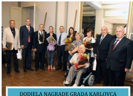
DODJELA NAGRADE GRADA KARLOVCA

• Svečana sjednica Gradskog vijeća održana u Zorin domu povodom proslave 436. rođendana grada Karlovca na kojoj su dodijeljene nagrade i priznanja. Nagrada Grada Karlovca dodijeljena je i Udruzi za ostvarene brojna postignuća i rezultate u stvaranju kvalitetnijeg života osoba s invaliditetom u zajednici.