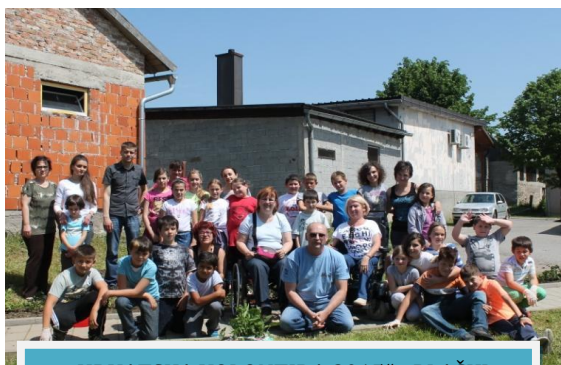
„HRVATSKA VOLONTIRA 2015“ - PLAŠKI