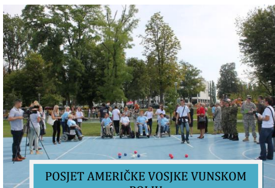
POSJET AMERIČKE VOJSKE VUNSKOM POLJU