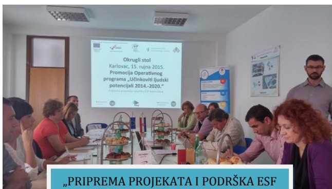
„PRIPREMA PROJEKATA I PODRŠKA ESF KORISNICIMA“