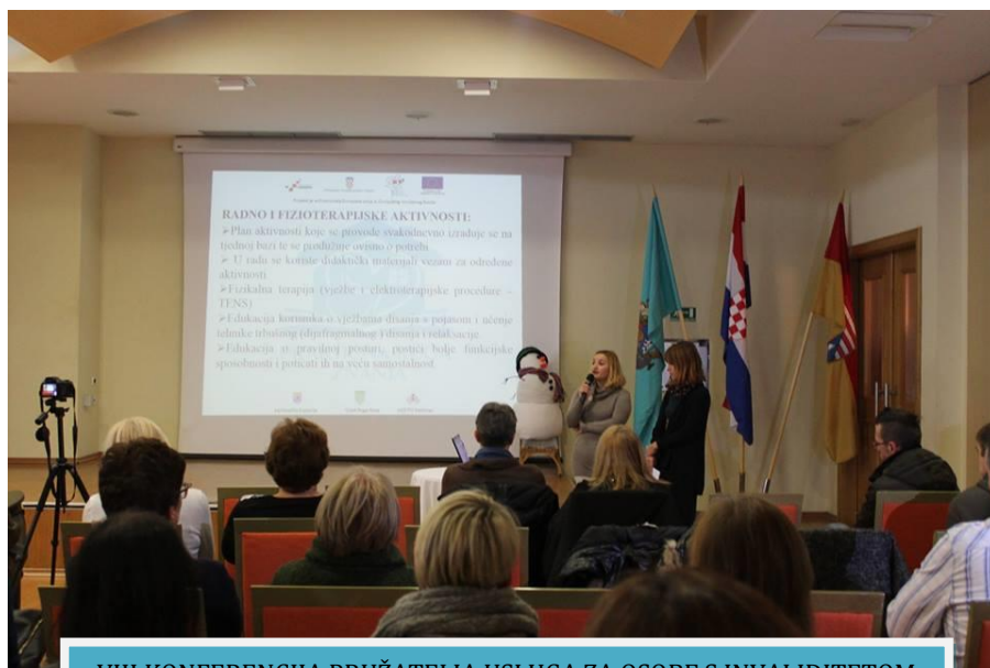
VIII KONFERENCIJA PRUŽATELJA USLUGA ZA OSOBE S INVALIDITETOM