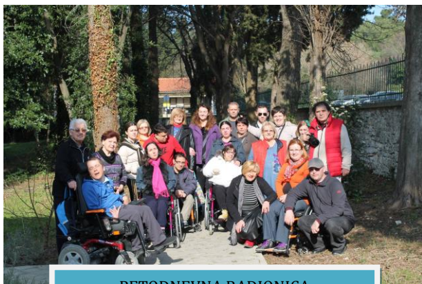
PETODNEVNA RADIONICA FOTOGRAFIJE "CAMERA OBSCURA"

• Petodnevna radionica fotografije "Camera obscura" u Rovinju, u organizaciji Hrvatskog fotosaveza. Na radionici su sudjelovali učesnici iz cijele Hrvatske te predstavnici mladih iz Udruge. Polaznici su tijekom radionice imali priliku promišljati, otkrivati i istraživati čaroliju svijeta, okoline koju inače ne zamjećuju, otkrivati svjetlo, sjenu i kontraste. Izabrani radovi čine zajednički koncept izložbe na manifestaciji Rovinj Photodays.