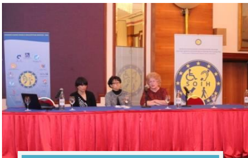
SASTANAK SA NZRCD