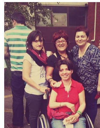
OKRUGLI STOL - HSUCDP