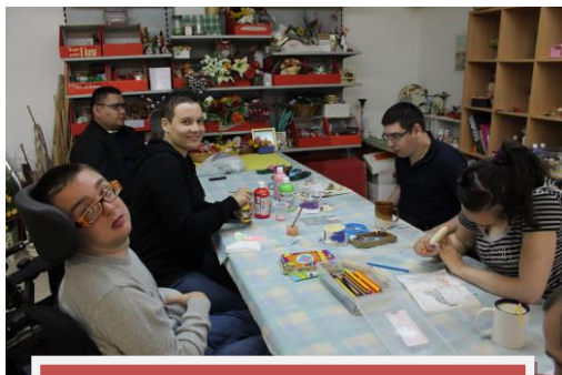
POJEDINAČNI JAVNI RADOVI

7.) Dva pojedinačna projekta Javnih radova putem mjera zapošljavanja Hrvatskog zavoda za zapošljavanje kroz paket mjere „Pomoć sebi i drugima“. Projektima su bile zaposlene: jedna osoba s invaliditetom i jedna osoba školovana po posebnom programu u periodu od 04. kolovoza 2014. do 03. kolovoza 2015. godine. Mjere Hrvatskog zavoda za zapošljavanje značajan su poticaj zapošljavanja kojim se unaprjeđuje kvaliteta djelovanja Udruge kao organizacije civilnog društva, a samim time utječe se i na bolju kvalitetu življenja dugotrajno nezaposlenih osoba.