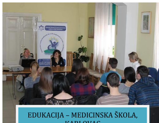
EDUKACIJA – MEDICINSKA ŠKOLA, KARLOVAC

• U zajedničkim prostorijama Udruga u Karlovcu održana edukacija za učenike 4.A razreda srednje Medicinske škole Karlovac, u organizaciji Udruge. Edukacija je provedena kao dio vježbi iz predmeta Zdravstvena njega - zaštita mentalnog zdravlja.